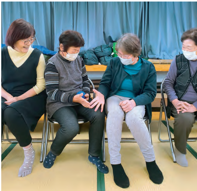
あ～いこ～でしよっ！ なかなか勝負がつきません（笑）

隣の人とじゃんけんを行い、自分が負けたら次の人に物を渡す、そして次の人とまたじゃんけん…単純なゲームですが、何回もあいこになったりして、だんだん二人が笑いはじめ、その様子を見て周りも笑顔に。ゲームが終わった頃には、みなさんどうやら笑い疲れた様子。笑顔がたくさんミニデイサービスとなりました。