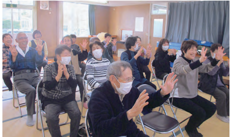
笑顔で体操、体も心もほかほかです

普段の生活を身体的な制限がなく、健康に過ごせる時間を健康寿命といいます。この健康寿命を延ばす要素として、栄養・運動・そして一番大切な要素は、社会的つながりです。