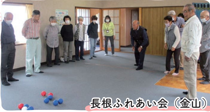
長根ふれあい会（金山）

男性も多く、ご夫婦での参加も多いサロン。 取材の日は金山自治会の職員さんにポッチャを準備していただき、初めてやる方がほとんどでしたが、みなさん楽しんでいらっしゃいました。 近所のみなさんで、高齢の方を見守っているというお話も伺い、地域のつながりを感じられる素敵なサロンだなと思いました。