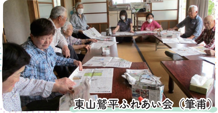
東山鷺平ふれあい会（筆甫）

男性も多く、ご夫婦での参加も多いサロン。 取材の日は金山自治会の職員さんにポッチャを準備していただき、初めてやる方がほとんどでしたが、みなさん楽しんでいらっしゃいました。 近所のみなさんで、高齢の方を見守っているというお話も伺い、地域のつながりを感じられる素敵なサロンだなと思いました。