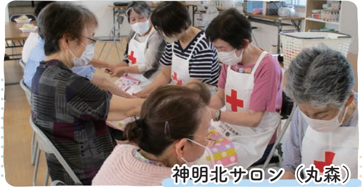
神明北サロン（丸森）

座ってできるレクリエーションを教えて！とのお声をいただき訪問してきました。 お手玉回し、わりばしダーツ、神経衰弱ゲームなど脳トレと組み合わせたゲームを行い、みなさん「むずかしい！」と言いながらも楽しんで行いました。小学校が近くにある地区なので、通学路の交通量の多さを心配されていました。