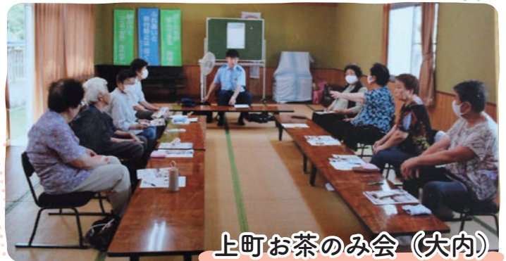
上町お茶のみ会（大内）

大内駐在所の駐在さんに来ていただき、防犯と交通安全についてのお話を聞きました。 年に何回か駐在さんからの講話をいただいております。地域の方々に日頃から注意喚起に努めています！