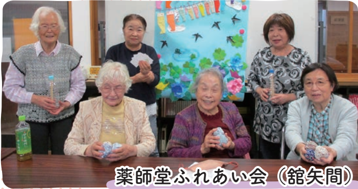
薬師堂ふれあい会（館矢間）

東山地区と鷺平地区と合同で行っているサロン。地区の人口が少なくなってきたことから、地区で定期的に集まって話すっ！ということで数年お休みしていたサロンを再開させたとのこと。今後も色々メンバーのみなさんが楽しめる企画を考えているそうです。