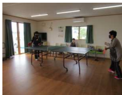
【志波姫】間海区卓球の会