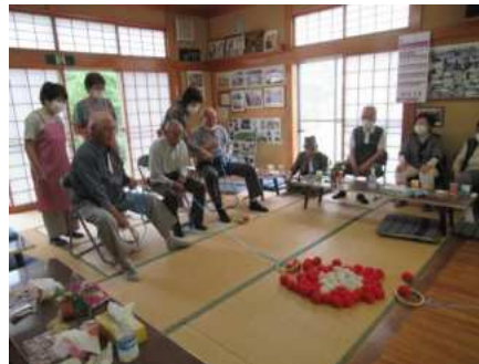
【若柳】 新山区ボランティア友の会 (P8)