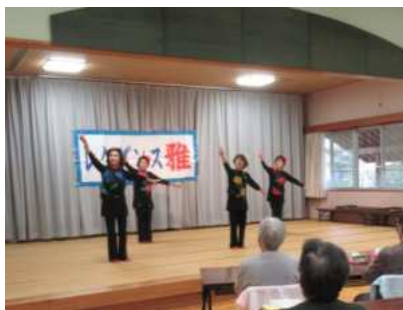
← 【栗駒】レクダンス雅