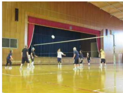
【瀬峰】瀬峰家庭バレーボール愛好会