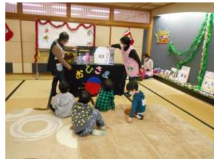
【瀬峰】よみきかせ「おひさま」 (P39)