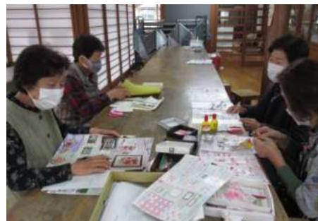
【栗駒】 和紙のあとり絵会