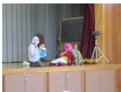
【志波姫】華龍 (宮中施設ボランティア) (P40)