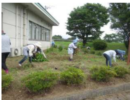
【鶯沢】 鶯沢地区ボランティア友の会 (P39)