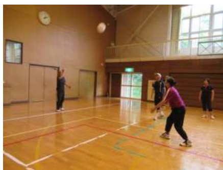
【高清水】シニア家庭バレーボール愛好会