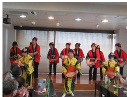
【金成】たてやま安心・安全見守り隊 (P39)