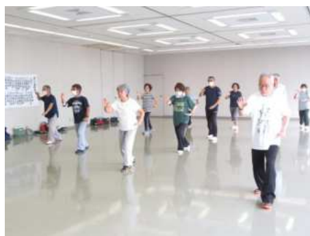
【築館】わかば拳好会 (P25)