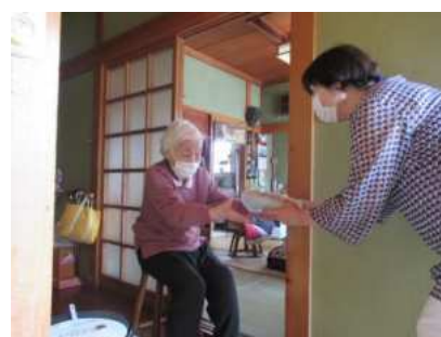
【一迫】いちばさま地区ボランティア 連絡協議会 (P38)