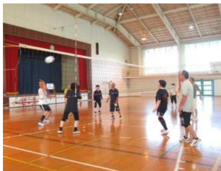
【築館】バレーボールチーム「ハイブリット」 (P25)