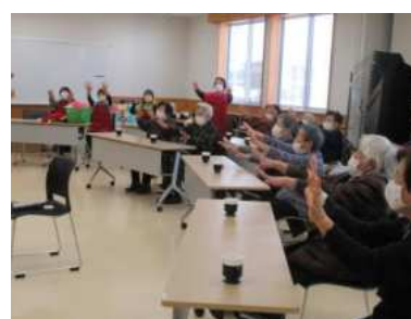
【志波姫】ボランティアグループ福寿草 (P40)