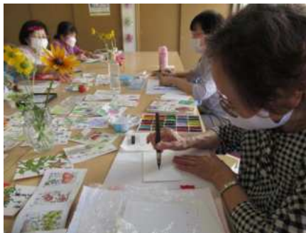
【栗駒】 絵手紙ひるこの会 (p9)