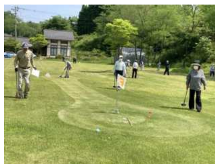
【鶯沢】グラウンド・ゴルフ 愛好会 (P30)