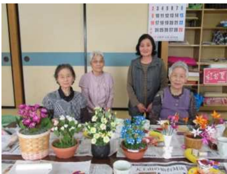
【一迫】 高齢者教室シルクフラワー教室