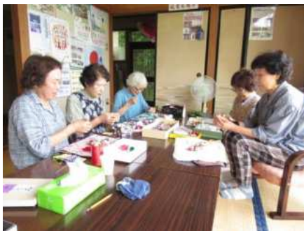
【築館】 築館根岸つるし飾り サークル (P5)