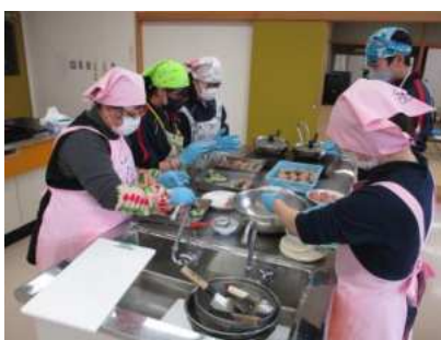
← 【高清水】 栗原市食生活 改善推進委員 協議会 高清水分会（P38）