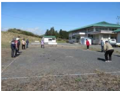
【一迫】 高齢者教室ペタンク愛好会