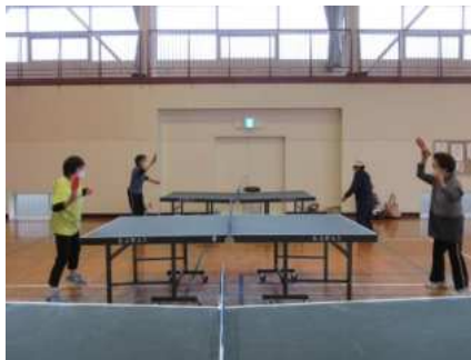
【瀬峰】杉の沢卓球愛好会