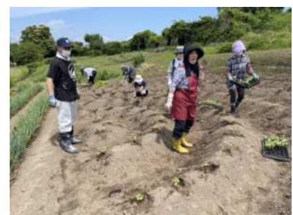
【高清水】→ 桂葉ひまわり 植栽有志会 （P38）