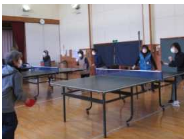
【栗駒】しゃくなげ卓球会