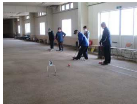
【一迫】 一迫ゲートボール協会 (P14)