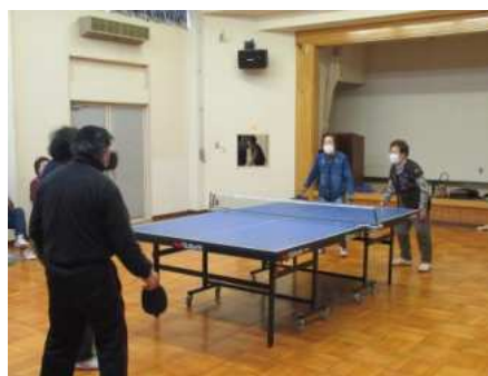
【高清水】ラージボールみずき会