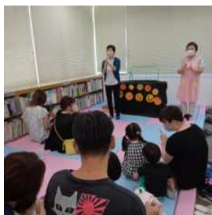
【若柳】若柳図書ボランティア 「ぽっかぽか」 (P36)