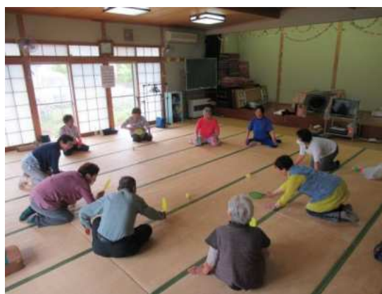
【志波姫】 はちみつレモン会