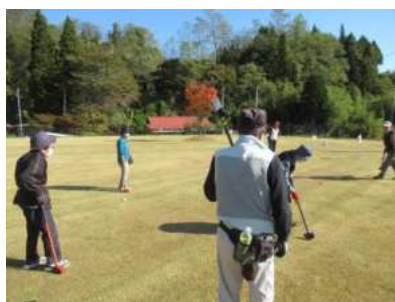
【花山】草木老人クラブ親和会