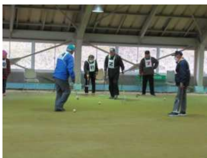
【金成】金成ゲートボール愛好会