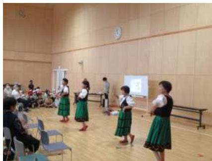
【若柳】若柳レクダンス すずらんの会 (P25)