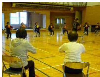
【一迫】 ヘルスアップ愛好会