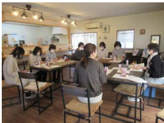
【志波姫】 ひまわりカフェ