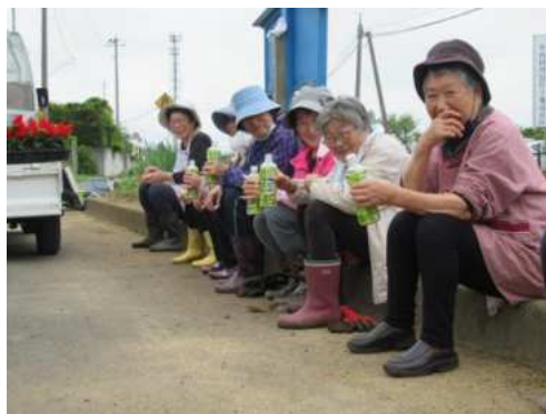
【高清水】老人クラブ桂会 (P11)