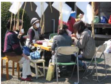
【若柳】 下町元気アップ会 (P8)