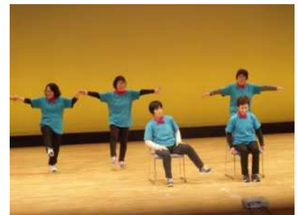
【若柳】 なでしこ会 (P25)