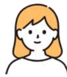
生活支援コーディネーター

〇〇団体は、体操後にお茶っこ会もやっている団体ですよ。団体の方に連絡してみますね。