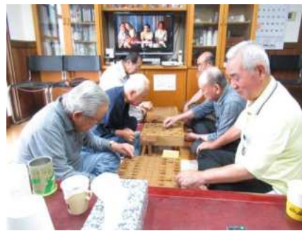
【築館】 将棋愛好会 (斎藤道場)