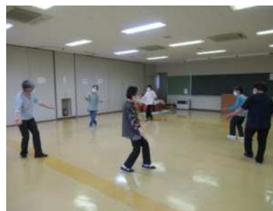
【花山】花山レクダンス愛好会